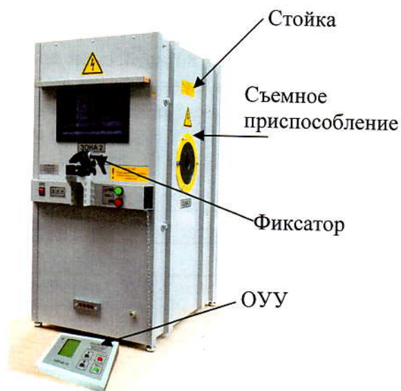
Рисунок 1 – Общий вид установки