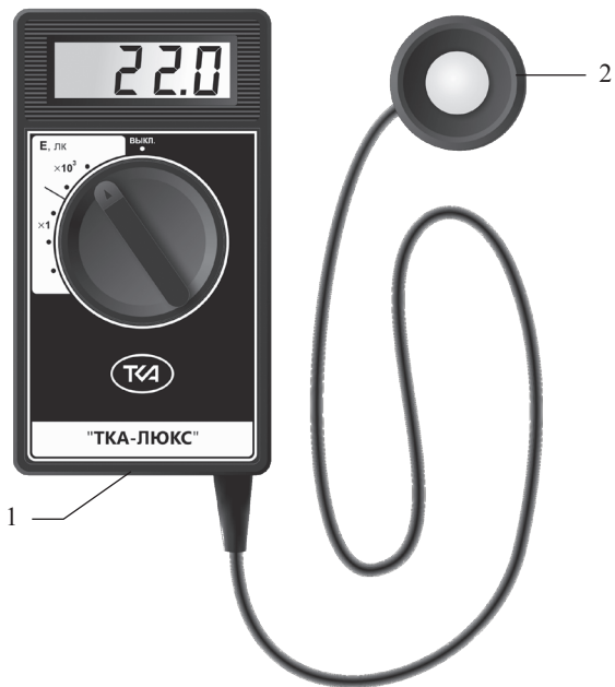
Рис.1 Внешний вид прибора “ТКА-Люкс”