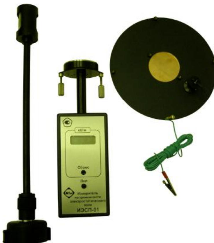
Рисунок 1. Фотография общего вида измерителей.